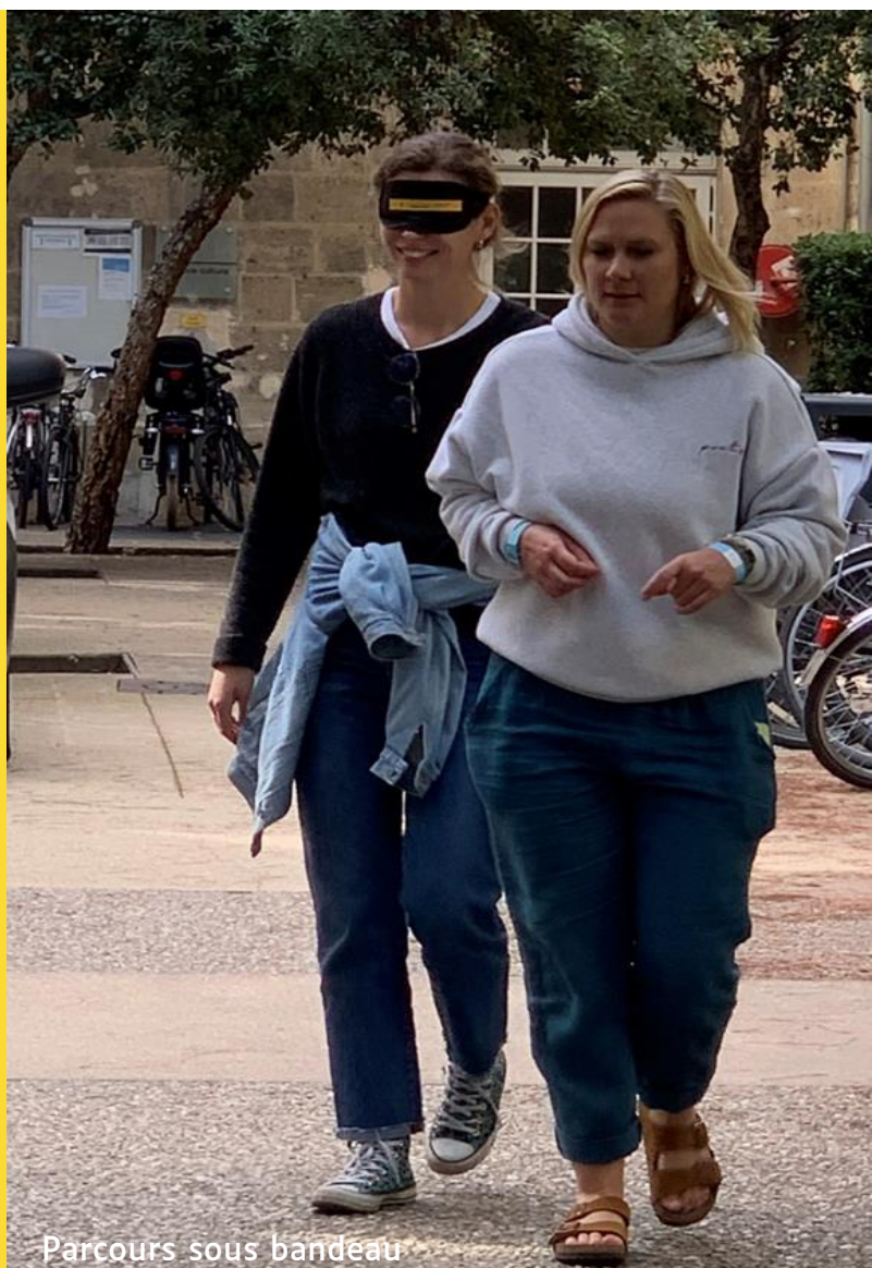
Parcours sous bandeau

La radio RCF est venue sur le stand et a réalisé une interview, à retrouver ici .