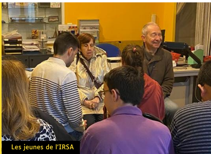
Les jeunes de l'IRSA

Les jeunes ont pu exprimer leurs souhaits et leurs idées de métiers. Ils ont aussi échangé sur leurs passions et les possibilités qui s'offrent à eux, pour s'épanouir et devenir des citoyens à part entière.