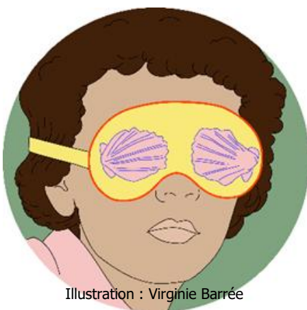
Illustration : Virginie Barré

Pour plus de renseignements : 05 56 00 81 50 capc@mairie-bordeaux.fr / Et sur le site du Capc.