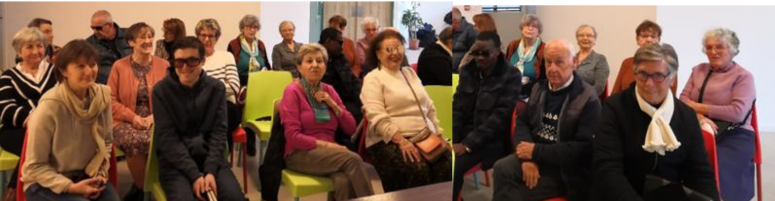
Un public attentif et de bonne humeur